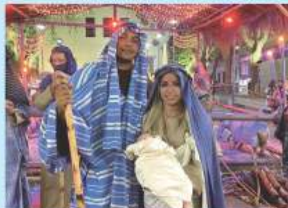
Encenação da chegada do Menino Jesus