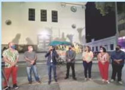
Representantes da CDL BM, Aciap, Sicomércio, SICOOB e Prefeitura de BM durante o cerimonial de abertura.