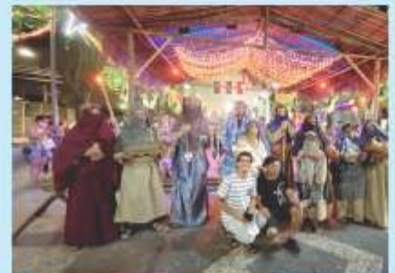
Apresentação teatral no Presépio na Praça da Matriz