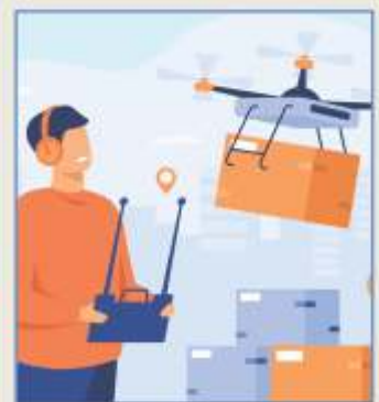
Veículos aéreos não tripulados - drones

A procura por estes dispositivos aumentou, graças à sua versatilidade e a uma redução em seu custo de produção e distribuição.